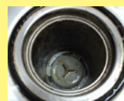
これまでの排水溝