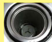
台所用酵素を使いだして2週間後